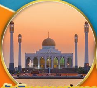
มัสยิดกลางสงขลา