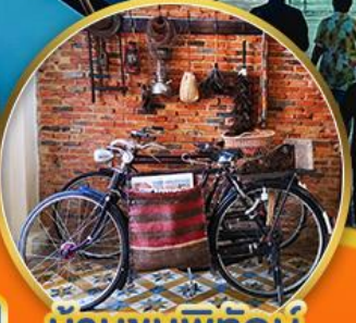
บ้านยูนพิทักษ์

พัก 4 ดาว Grand Mandarin Betong Hotel 2 คืน